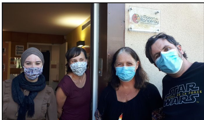
Equipe de choc prête à vous accueillir :-)

Mardi 15 septembre à 14h30. Départ de la Maison du Ronceray, pour une heure de balade dans le quartier. Gratuit. Sur inscription (jauge limitée à 10 personnes).